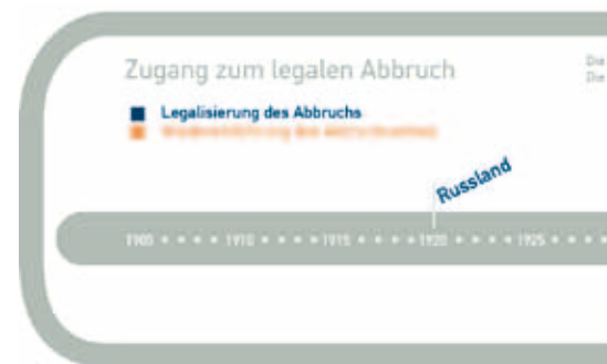
Abb.: 1 Historische Entwicklung des legalen

Es gibt auch einige Frauen in der Frühschwangerschaft, die den restriktiven Vorschriften im eigenen Land ganz bewusst ausweichen (siehe pro familia magazin 2007;1:7–9). Als Gründe werden von den betroffenen Frauen vor allem das gesetzlich verpflichtende Gespräch genannt und eine vorgeschriebene Bedenkzeit. Ein gesetzlich verpflichtendes Gespräch mit einer schriftlichen Be-